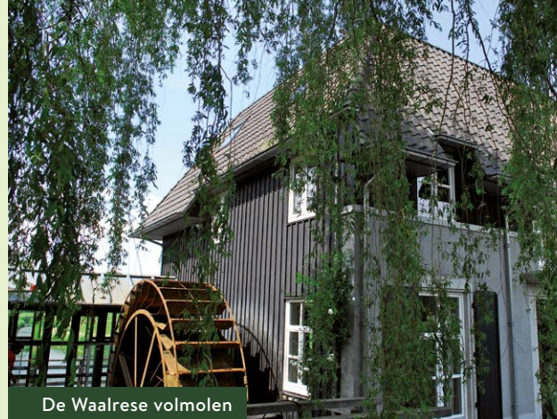
De Waalrese volmolen

Kp 61 – kp 44 | Op kruising bij kp 61 RD en direct RA kp 45 volgen. Bij de eerste zijweg (dubbelbaans fietspad) RA . Bij kp 45 RD weg oversteken en Gildebosweg in ri kp 91 . Na 250 meter op splitsing RA ri kp 91 . Bij kp 91 LA , Loonderweg ri kp 44 . Over Loonderweg RD . Na bocht naar R heet weg Timmereind. Op splitsing RA ri kp 44 . Aan het eind weg oversteken en op fietspad bij kp 44 LA ri kp 25 .