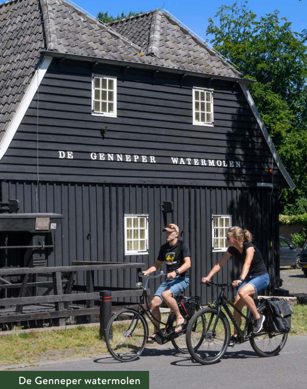
De Genneper watermolen